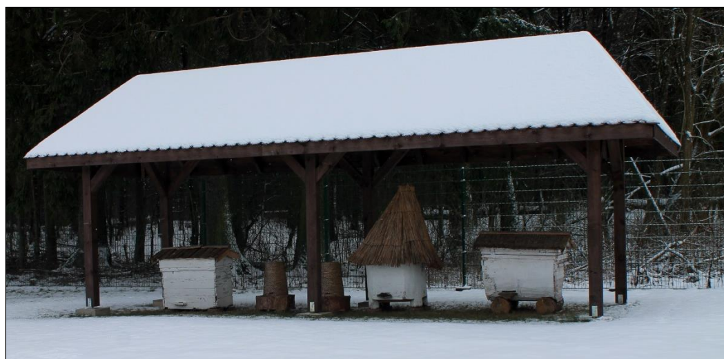
Fot. Ekspozycje bartnicze