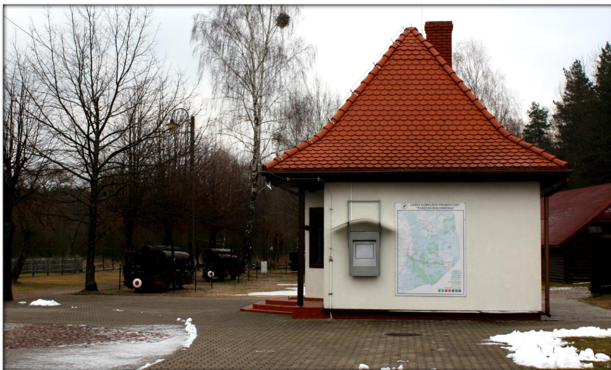
Fot. Skansen Kolejek Wąskotorowych (fot. P. Król)

Skansen Kolejek Wąskotorowych przy Dworcu Kolejek Leśnych, składa się z eksponatów zabytkowej infrastruktury kolejek wąskotorowych, tj.: parowóz z wagonami (zdj. 1), tendery (integralne części parowozu służących do przewozu wody i drewna z lat 1918-1920), węglarka i piaskarka oraz platforma, a także zestaw kłonicowy typu niemieckiego wyprodukowany w 1952 oraz typu polskiego z 1948 (zdj. 2 i 3). Skansen jest doskonałym miejscem do prowadzenia zajęć na zarówno dla najmłodszych na temat wąskotorowych kolejek leśnych, jak i młodzieży na temat historii przemysłowego wykorzystania kolejek w Puszczy Białowieskiej, zamienionego w latach 90-tych na funkcję turystyczną i edukacyjną.