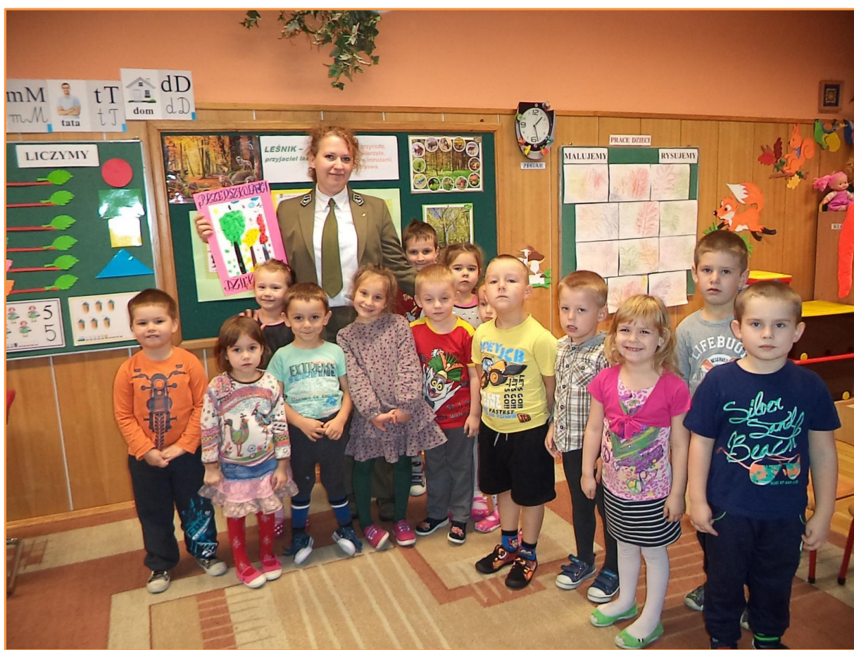
Fot. Zajęcia w przedszkolu z leśnikiem