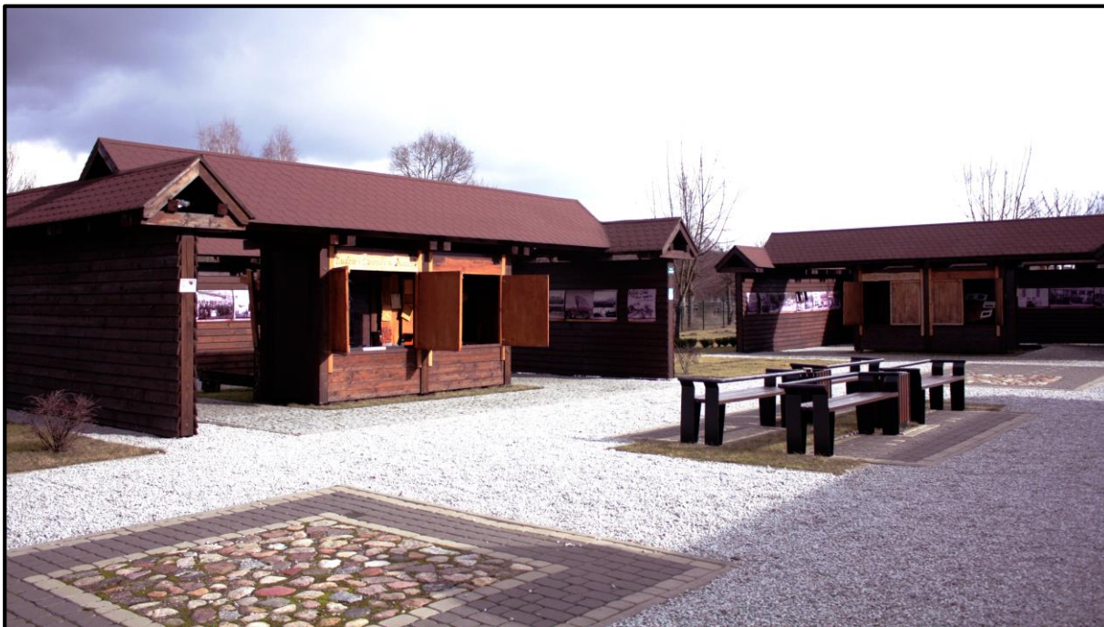
Fot. Skansen Kolejek Wąskotorowych (fot. P. Król)