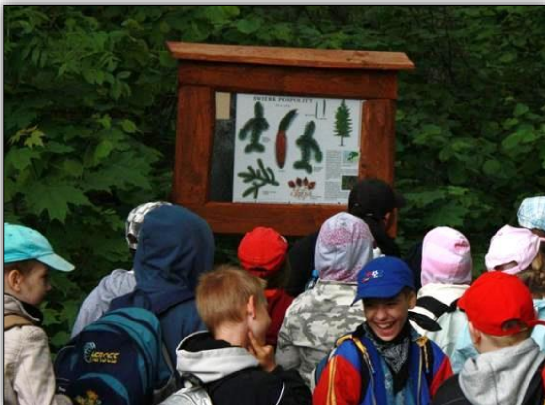
Fot. Jeden z przystanków na ścieżce „Puszczańskie drzewa”

Ścieżka znajduje się w miejscowości Topiło wokół śródleśnych stawów na rzece Perebel, przy ostatnim przystanku kolejki. Ścieżkę w kształcie pętli wytyczono na odcinku 4 km. Na jej trasie ustawiono tablice opisujące podstawowe gatunki drzew występujących w puszczy, skansen wąskotorowej kolejki leśnej oraz kapliczkę ekumeniczną.