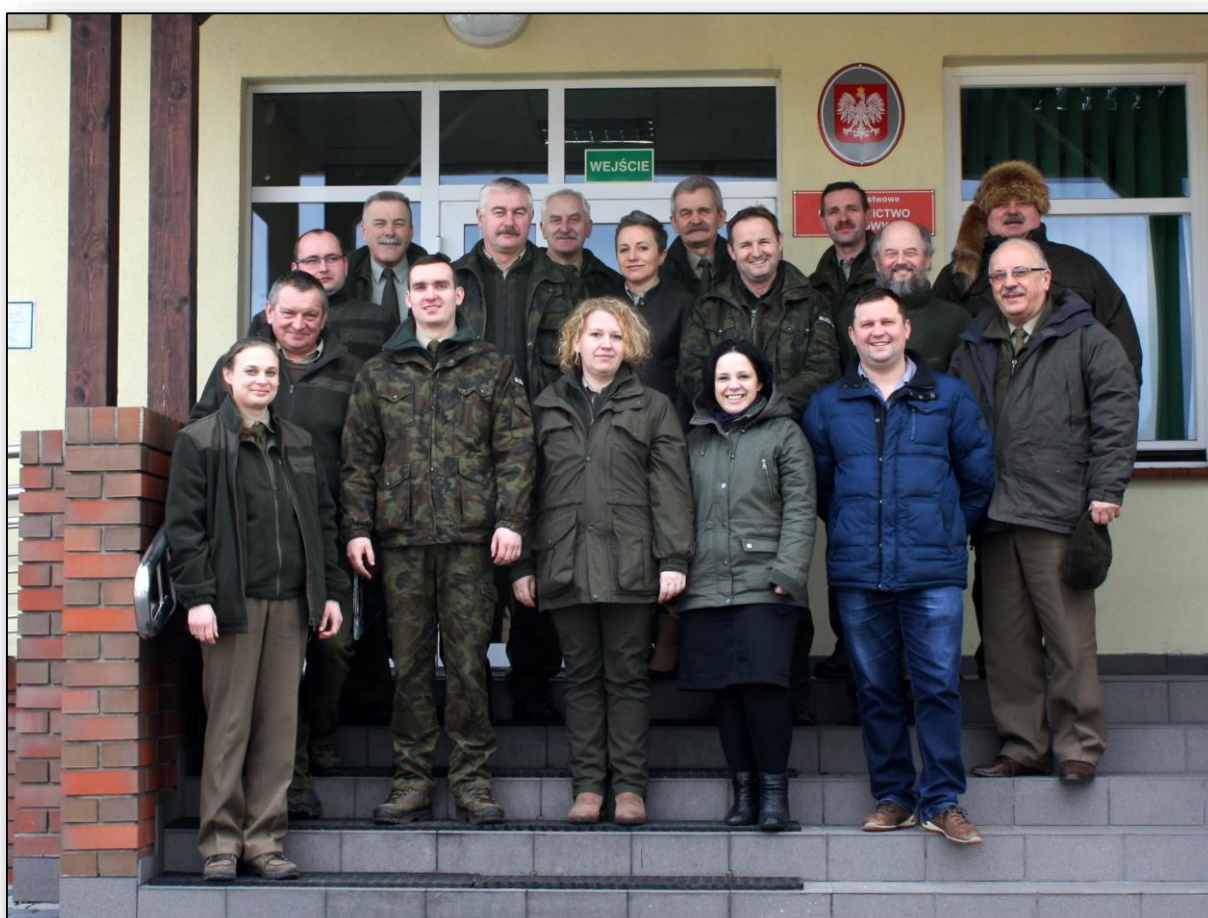
Fot. Grupa edukatorów Nadleśnictwa Hajnówka, 2016 (fot. M. Wakulińska)

ZAJĘCIA EDUKACYJNE W NADLEŚNICTWIE HAJNÓWKA PROWADZONE SĄ PRZEZ WYKWALIFIKOWANĄ KADRĘ LEŚNIKÓW, PRZYRODNIKÓW I EDUKATORÓW. WCIĄŻ PODNOSIMY NASZE KWALIFIKACJE, BY ZAPEWNIĆ UCZESTNIKOM ZAJĘCIA NA NAJWYŻSZYM POZIOMIE MERYTORYCZNYM. EDUKACJA PROWADZONA JEST PRZEZ ZESPÓŁ DS. EDUKACJI, PRACOWNIKÓW NADLEŚNICTWA ORAZ LEŚNICZYCH I PODLEŚNICZYCH OPIEKUJĄCYCH SIĘ LEŚNICTWAMI ZNAJDUJĄCYMI SIĘ NA TERENIE ZARZĄDZANYM PRZEZ NADLEŚNICTWO HAJNÓWKA.