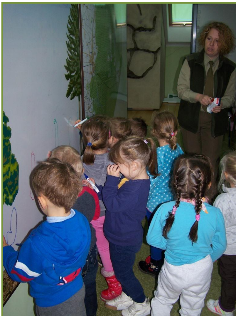
Fot. Zajęcia w sali edukacyjnej

Izba edukacyjna wyposażona jest w sprzęt multimedialny, plansze, instalacje reliefowe, płaskorzeźby przedstawiające tropy zwierząt oraz cykl rozwojowy modraszka. Przekrój przez mrowisko pozwala prześledzić zwyczaje ekologiczne modraszka i mrówek. W izbie są też tablice magnetyczne do zabaw edukacyjnych. Izba umożliwia prowadzenie zajęć bądź też pokazów dla grupy do 40 osób.