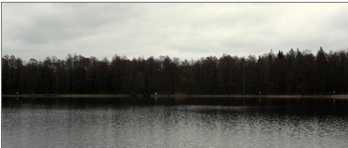
Fot. Widok na ścieżkę edukacyjną „Puszczańskie drzewa”