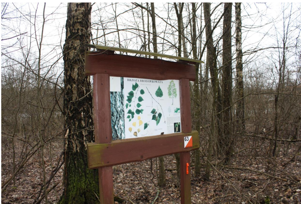
Fot. Przystanek na ścieżce „Puszczańskie drzewa”, widoczny również Zielony Punkt Kontrolny