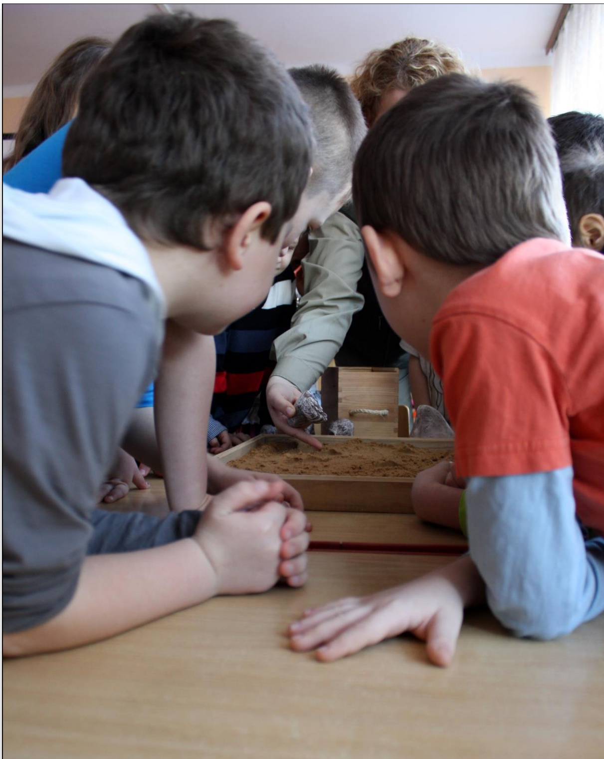
Fot. Nauka tropów w przedszkolu