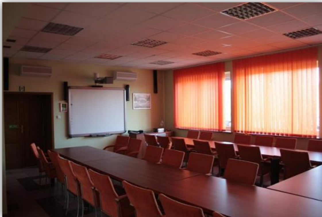
Fot. Prezentacja w sali multimedialnej Nadleśnictwa Hajnówka

Sala multimedialna wyposażona jest w sprzęt multimedialny, stoły i krzesła umożliwiające prowadzenie zajęć, warsztatów bądź też pokazów dla grupy do 45 osób.