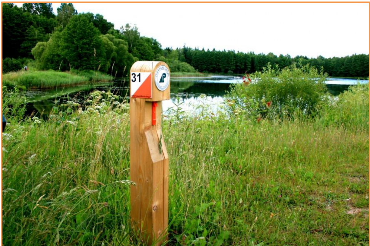
Fot. Zielony Punkt Kontrolny na Topile (fot. J. Kaczan)

Trasy są dostosowane dla różnych grup wiekowych i sprawności biegowej, posiadają różną długość i różne poziomy trudności.