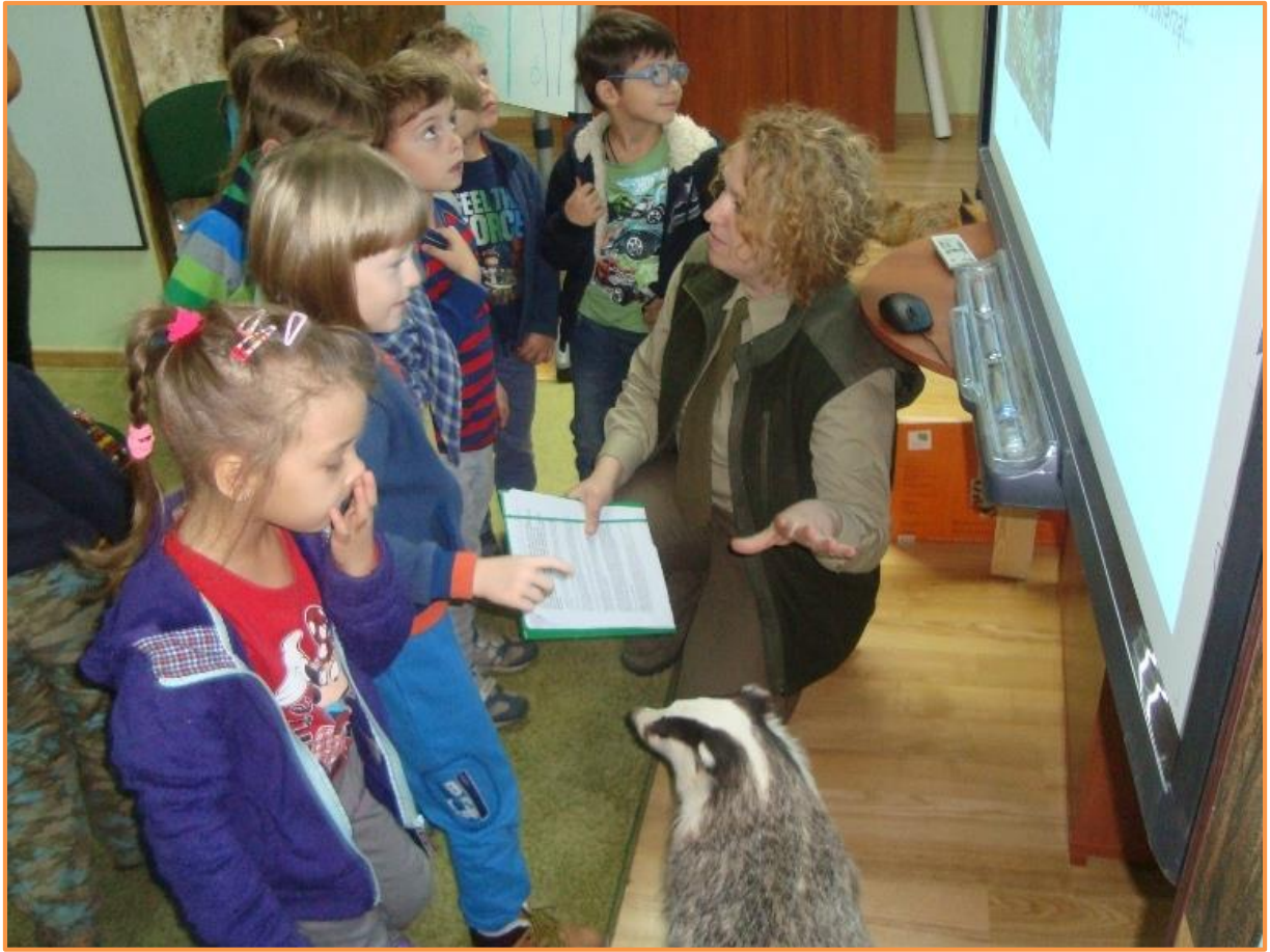
Fot. Zajęcia w sali edukacyjnej