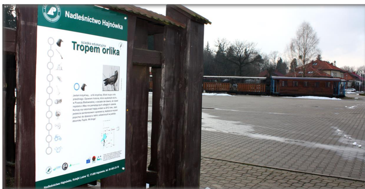
Fot. Przystanek początkowy ścieżki Tropem Orlika