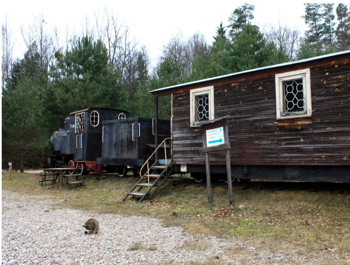
FOT. SKANSEN KOLEJEK WĄSKOTOROWYCH NA TOPILE, JEDEN Z PRZYSTANKÓW ŚCIEŻKI EDUKACYJNEJ