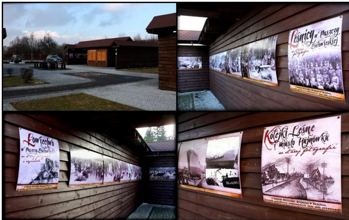
Fot. Leśny Zaulek Historyczny

„Leśny Zaulek Historyczny” to punkt edukacyjny przy siedzibie Nadleśnictwa, składający się z 3 wiat wystawowych przedstawiających zagadnienia związane z leśnictwem, łowiectwem, historią miasta Hajnówka i kolejek leśnych.