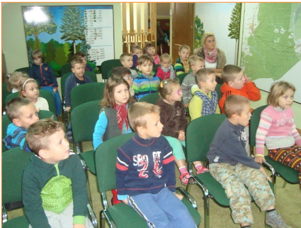
Fot. Zajęcia w sali edukacyjnej

W pracy z młodzieżą w wieku ponadgimnazjalnym sprawdzoną formą zajęć jest akcja, metoda atrakcyjna i nowatorska. Powodzeniem wśród młodzieży cieszą się tematyczne spotkania przy ognisku, rajdy. Poprzez stosowanie metod dyskusyjnych (za i przeciw, burza mózgów) umożliwia się uczniom prezentowanie własnych poglądów. Atrakcyjną formą zajęć w ramach edukacji leśnej może być udział w pracach gospodarczych na powierzchniach leśnych.