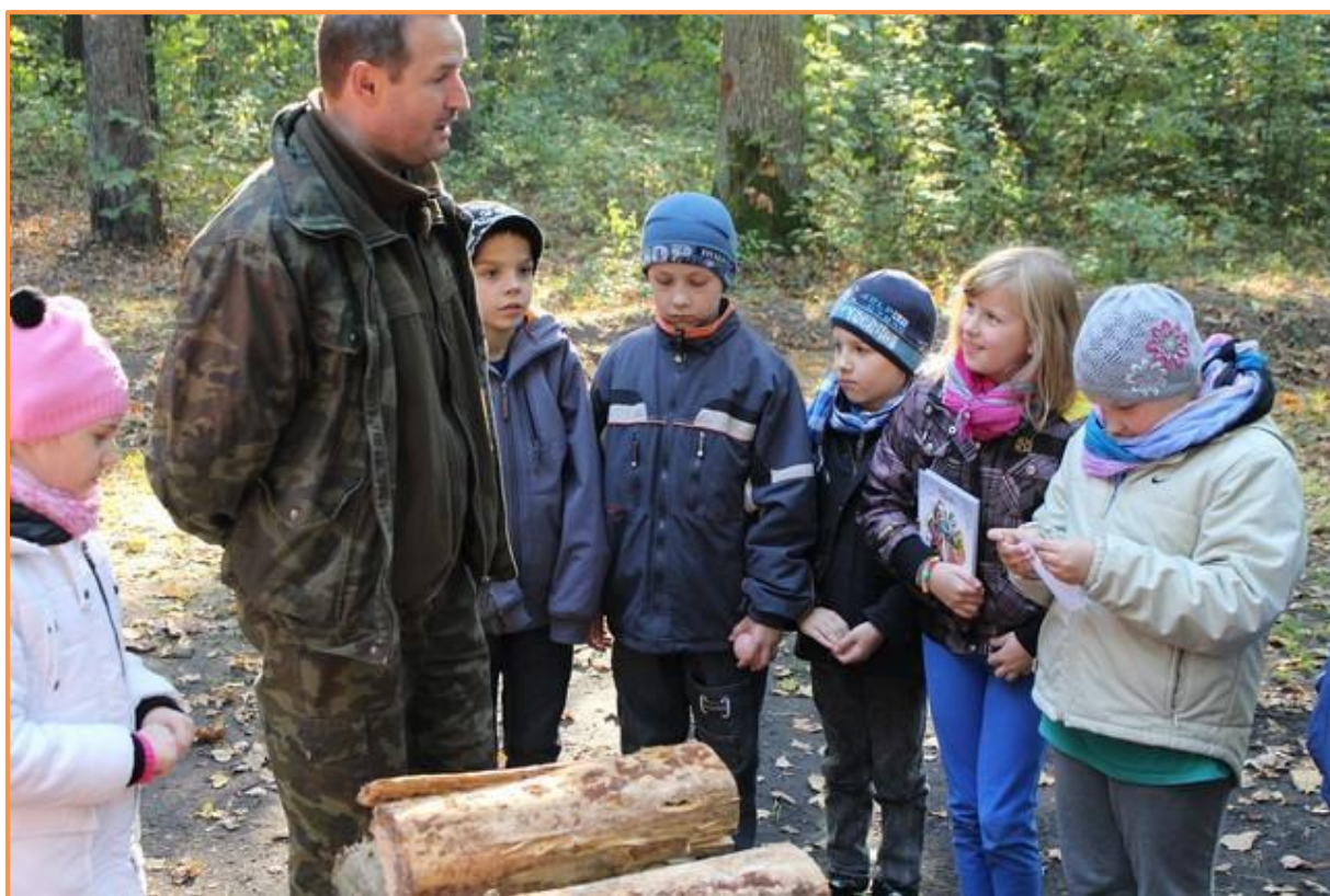
Fot. Zajęcia w terenie z leśniczym