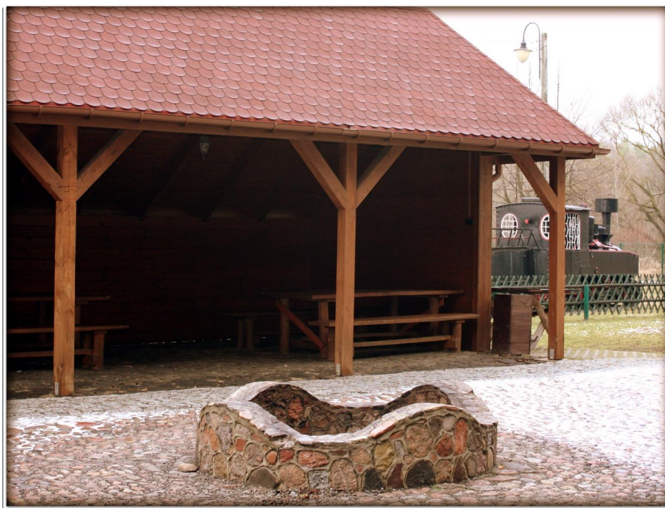
Fot. Wiata do zajęć z miejscem ogniskowym

Punkt rekreacyjny zlokalizowany w sąsiedztwie Dworca Kolejek Leśnych składa się z wiaty, stołów i ław, przy których można usiąść, by posłuchać wykładu lub zjeść przyniesione ze sobą kanapki. Wiata jest oświetlona. Przy punkcie znajduje się również miejsce ogniskowe oraz toalety z bieżącą wodą.